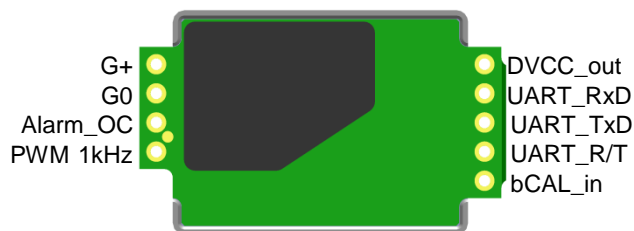
Рис. 2. Назначение контактов