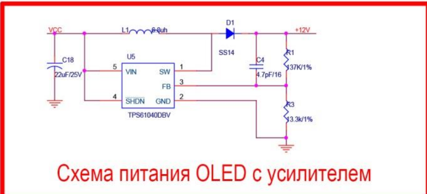
Схема питания OLED с усилителем